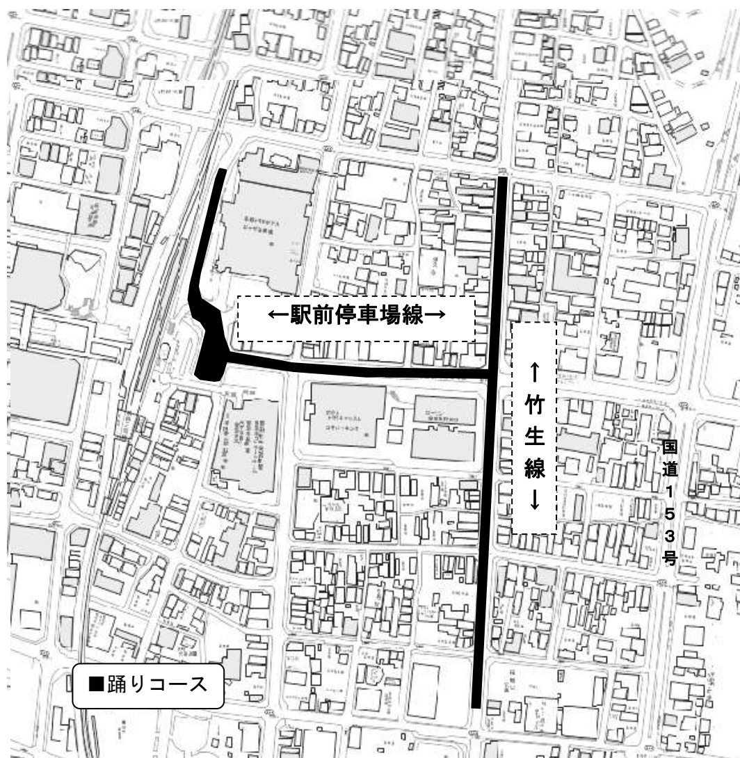
おいでんファイナル会場図（案）