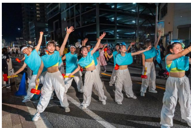
高校生による「青春おいでん」