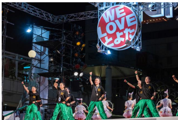
おいでん大賞連によるステージでの踊り披露