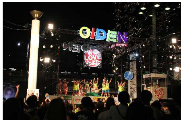
おいでん大賞連によるステージでの踊り披露