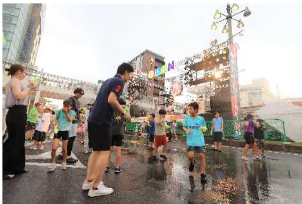
スプラッシュおいでん