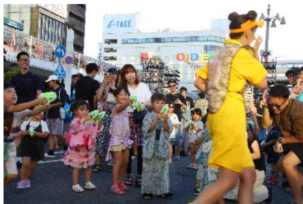
「スプラッシュおいでん」